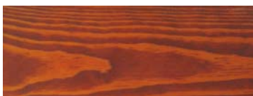
HI 2014 MAHOGANY