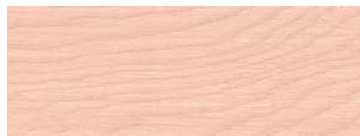
HI 2019 WHITE