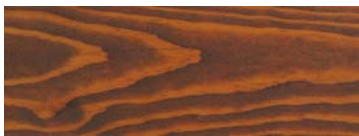
HI 2012 WALNUT