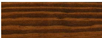
HI 2013 DARK WALNUT