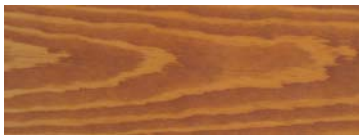
HI 2011 CHESTNUT